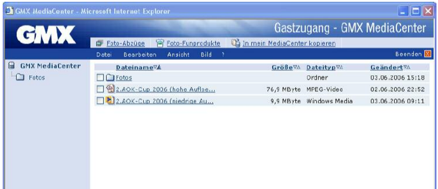
Abb. 2: GMX MediaCenter

Es öffnet sich ein neues Fenster, welches die im GMX MediaCenter zum Download freigegebenen Dateien anzeigt (Abb. 2 und 3).