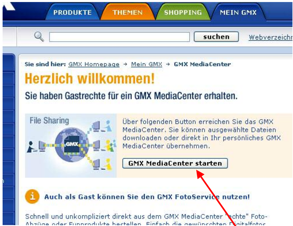
Abb. 1: Zugang zum GMX MediaCenter

Nach Aktivierung des Links Download öffnet sich ein separates Fenster mit dem Zugang zum GMX MediaCenter (Abb. 1).