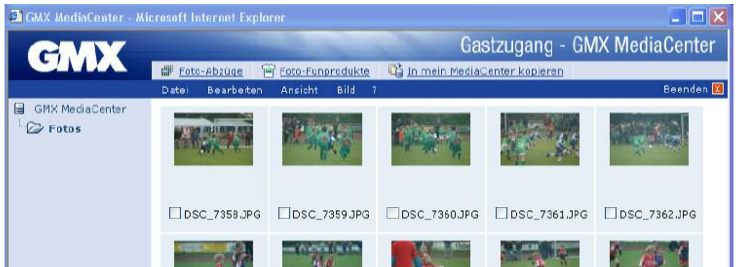
Abb. 3: GMX MediaCenter